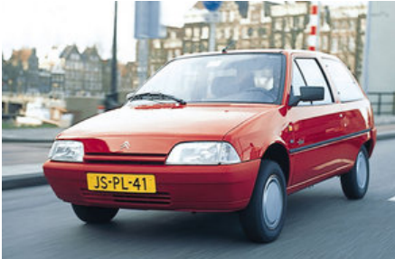
3-deurs, hatchback 1991-1996