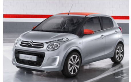
5-deurs, hatchback 2014-...