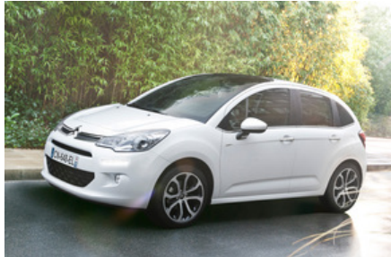
5-deurs, hatchback 2013-...